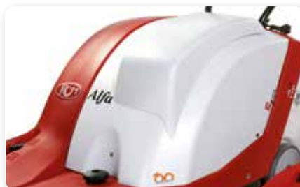
COFANO MAGGIORATO OVERSIZE BONNET CAPÓ MEJORADO