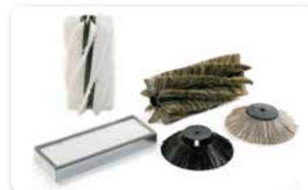
SPAZZOLE E FILTRI BRUSHES AND FILTERS CEPILLOS Y FILTROS