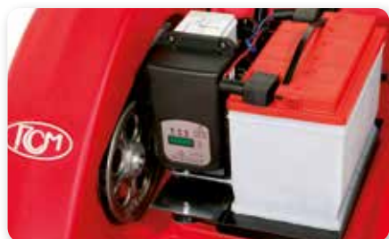
CARICA BATTERIA ON-BOARD ON-BOARD BATTERY CHARGING CARGADOR DE BATERÍA INCORPORADO